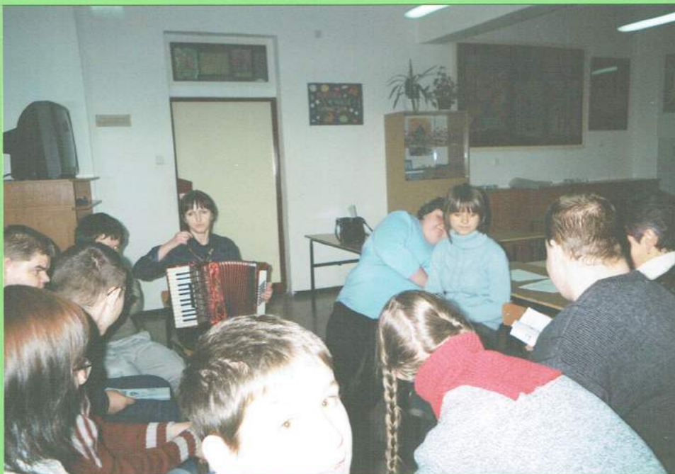
No i wielkie próby śpiewania kolęd i pastorałek!