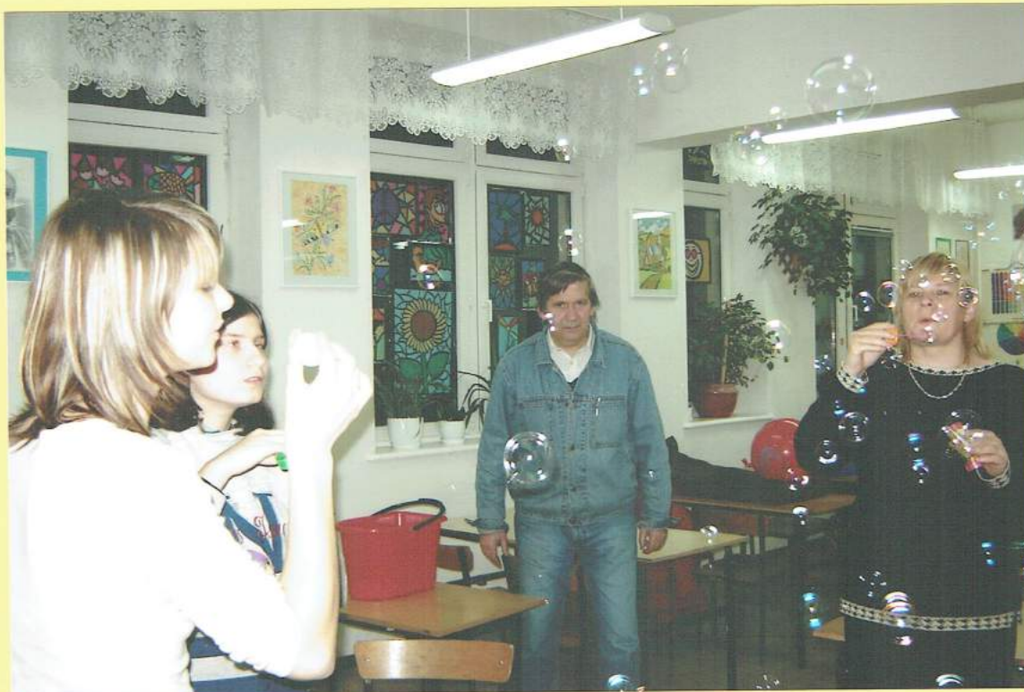
Duże i małe – różnokolorowe!