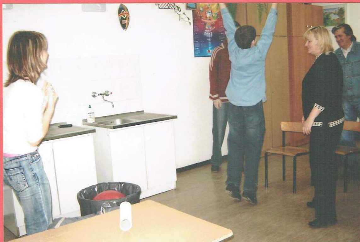
Które pozwolą na poprawienie sprawności ruchowej! A radość jest zawsze!