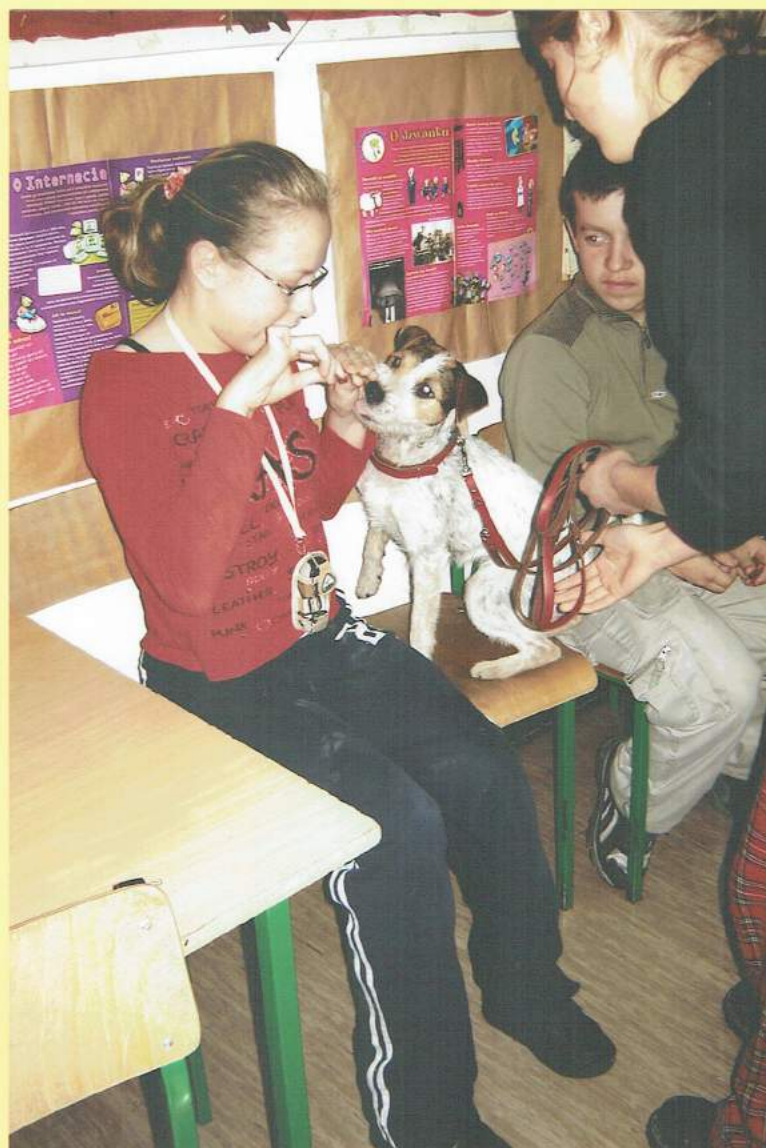
Przekąska dla Di