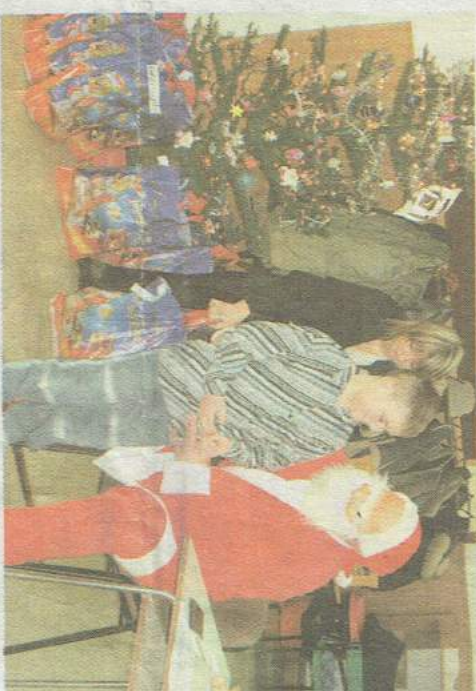
Święty Mikołaj wręczał prezenty