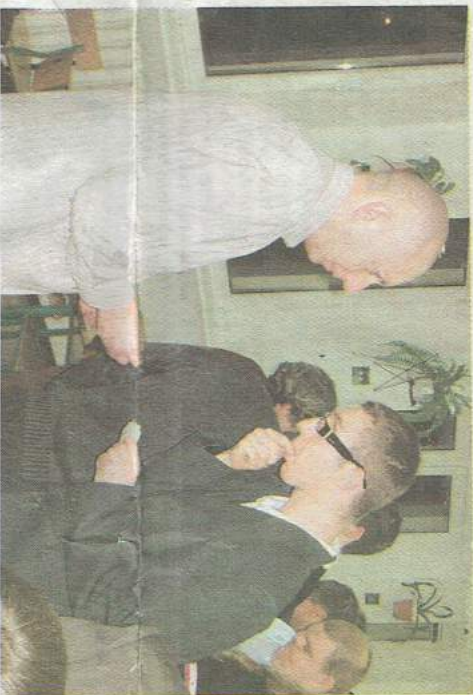
Najlepsze życzenia dla każdego