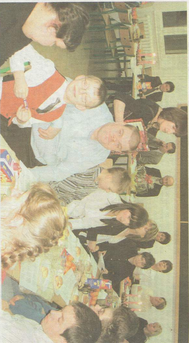
„Tutaj spotkasz przyjaciela, wiele radość w serce” - śpiewali podopieczni „Iskierki”