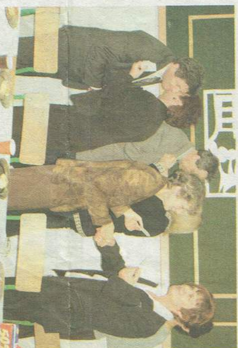
Dyrekcja Zespołu Szkół oraz przyjaciele - sponsorzy „Iskierki”