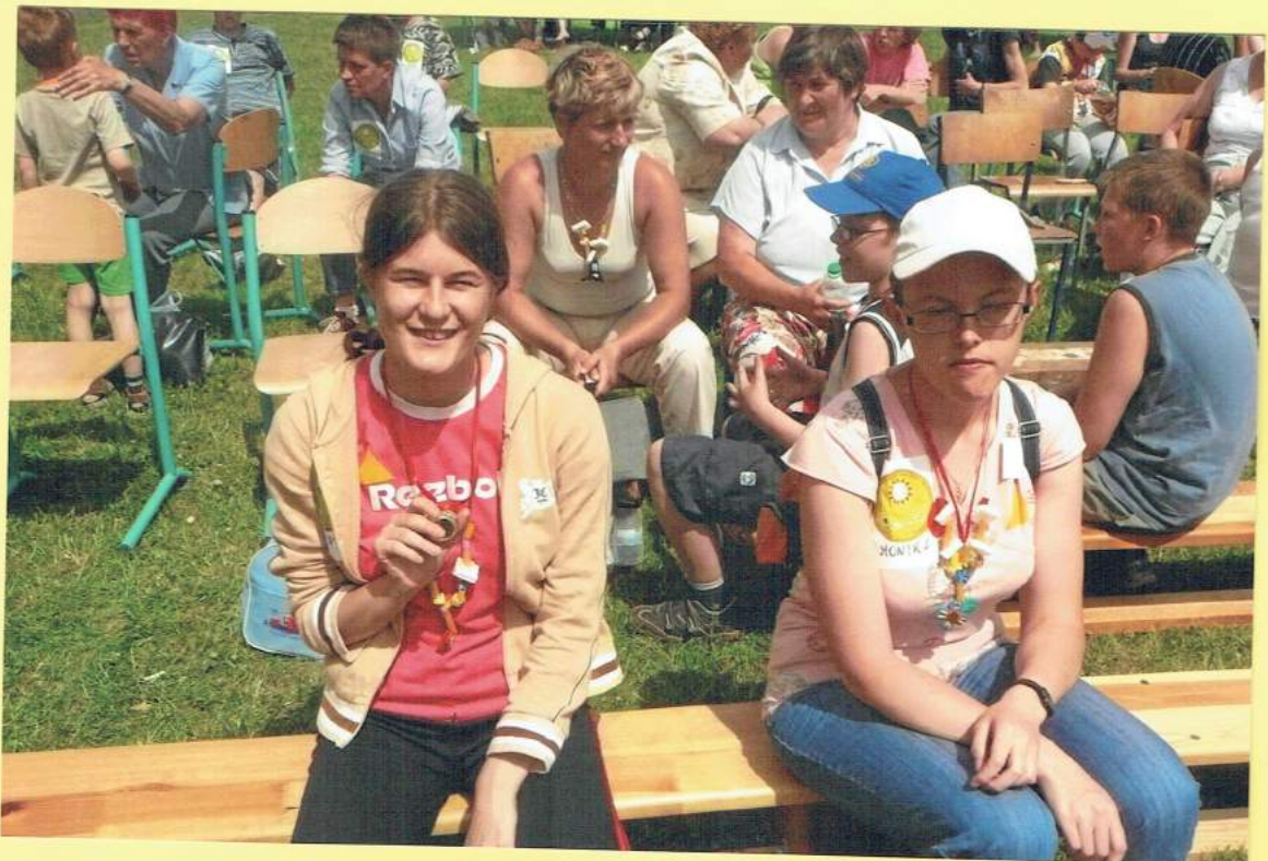
Wszyscy są zwycięzcami!!!