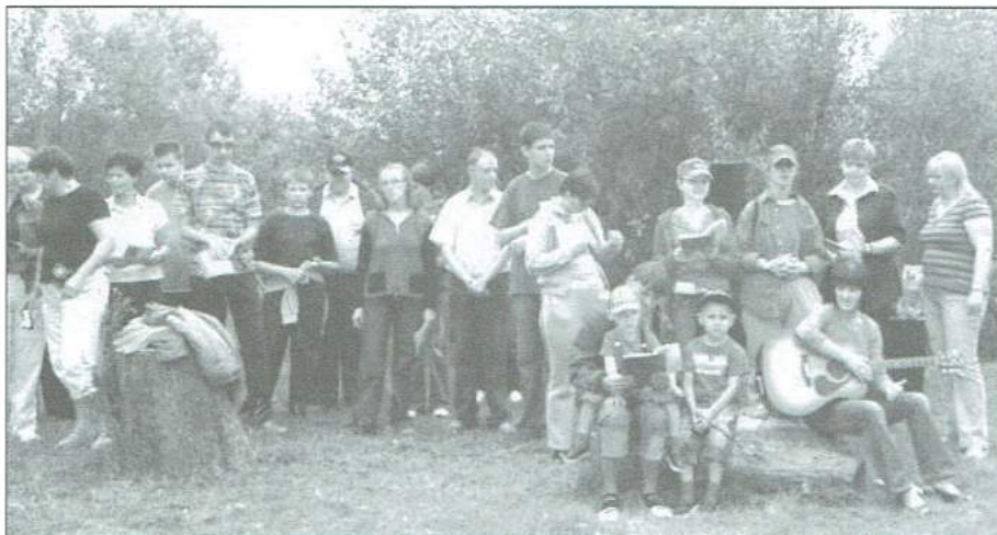
Zaśpiewali dla gości...