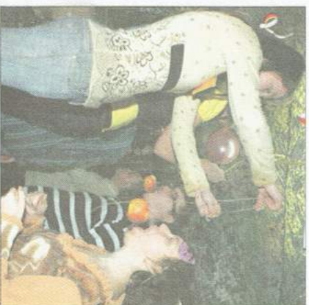
Trudny konkurs na jak najszybsze schrupanie wiszącego na sznurku jabłka