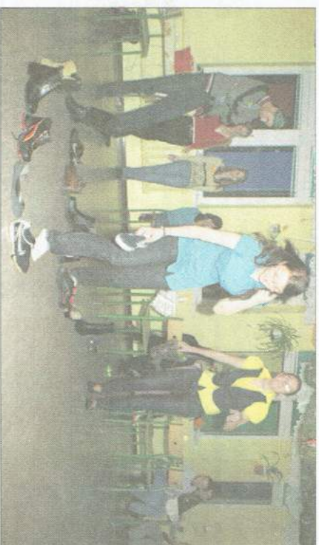
Stonoga ułożona z butów cierpliwie zmierzała do wyjścia. Właściciel trzewika, który dotknął progę, jeszcze w tym roku zmieni stan cywilny