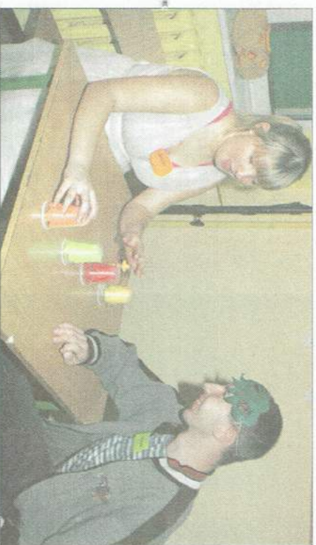
Cztery kubeczki, a pod każdym ukryta inna przepowiednia. W takiej sytuacji, potrzeba dłuższej chwili do namysłu

jako świetlica dla niepełnosprawnych, ale stowarzyszenie w pełnym znaczeniu tego słowa. Właśnie dlatego już na początku przyszłego roku będziemy się starać pozyskać zdecydowanie więcej środków na organizację takich imprez. Już teraz zajęcia, które prowadzimy, to nie tylko na pracy w świetlicy, ale również na treningach sportowych, zarówno w plenerze jak i z wykorzystaniem miejscowej hali gimnastycznej. Jeszcze przed bożonarodzeniowymi świętami, 18 grudnia zorganizujemy mikotajkę dla naszych wychowanków.