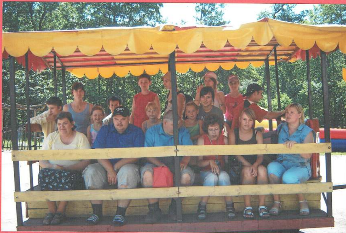
Przejażdżka wokół Miasteczka lokomotywą