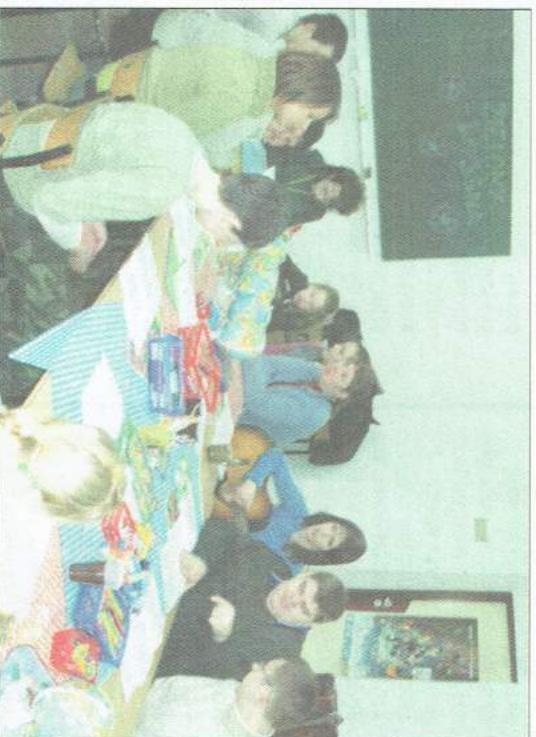
Na początku zawsze jest muzyka i wspólne śpiewanie