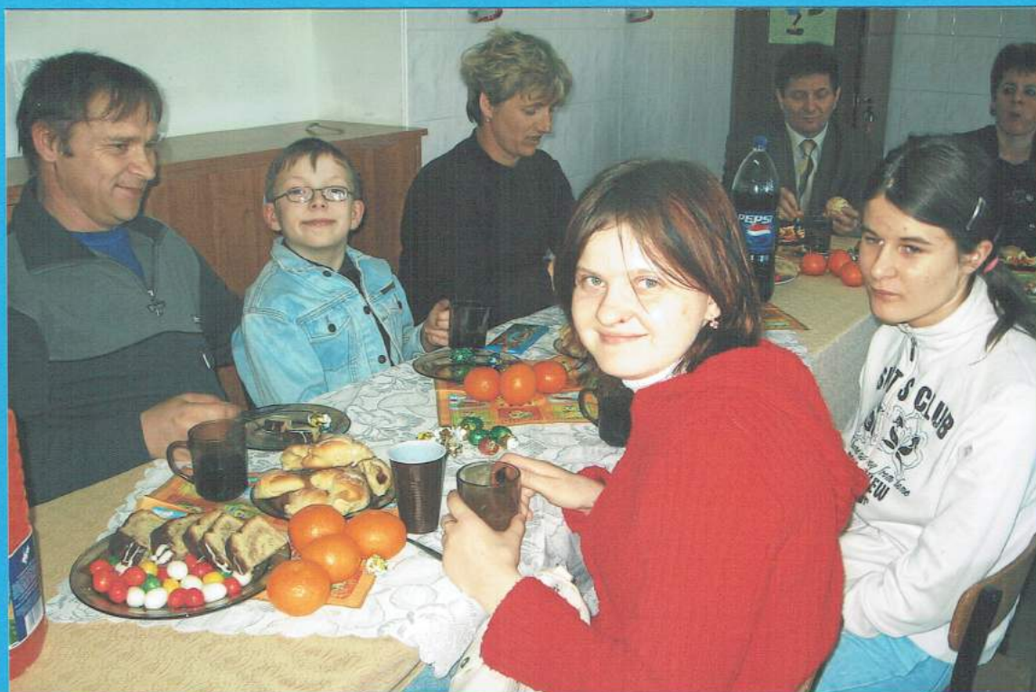
Kolejny raz towarzyszyli nam rodzice,