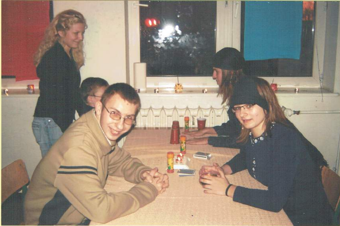
wrózby z kart,