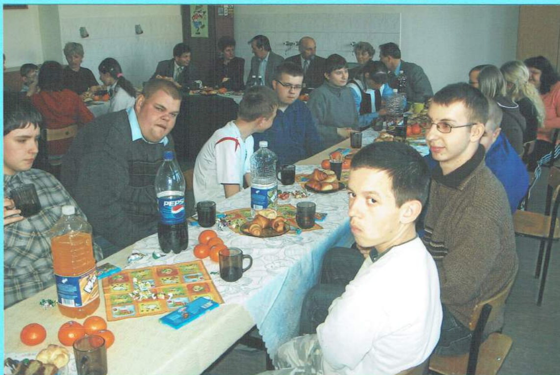
Kolejne spotkanie wigilijne z naszymi przyjaciółmi.