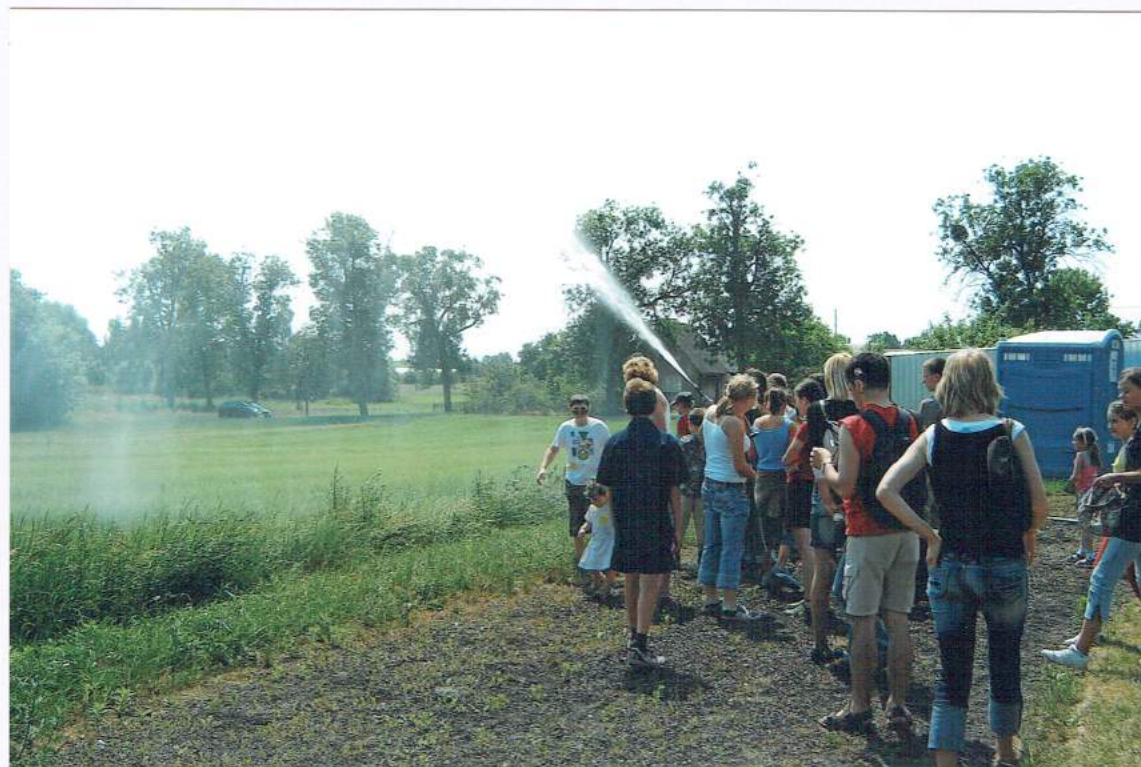
W przerwie między zawodami odbył się pokaz strażacki. Było tak upalnie, że można było biegać pod mgiełką zimnej i chłodzącej wody!