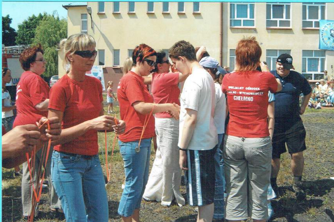
Ważny moment – wręczenie medali! Zasłużyli wszyscy – bez wyjątku!