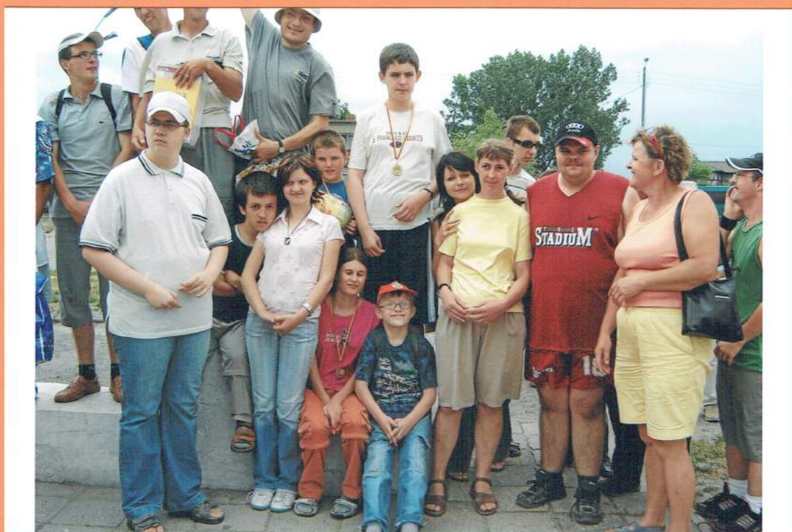
oraz cała drużyna ISKIERKA – III miejsce drużynowe!