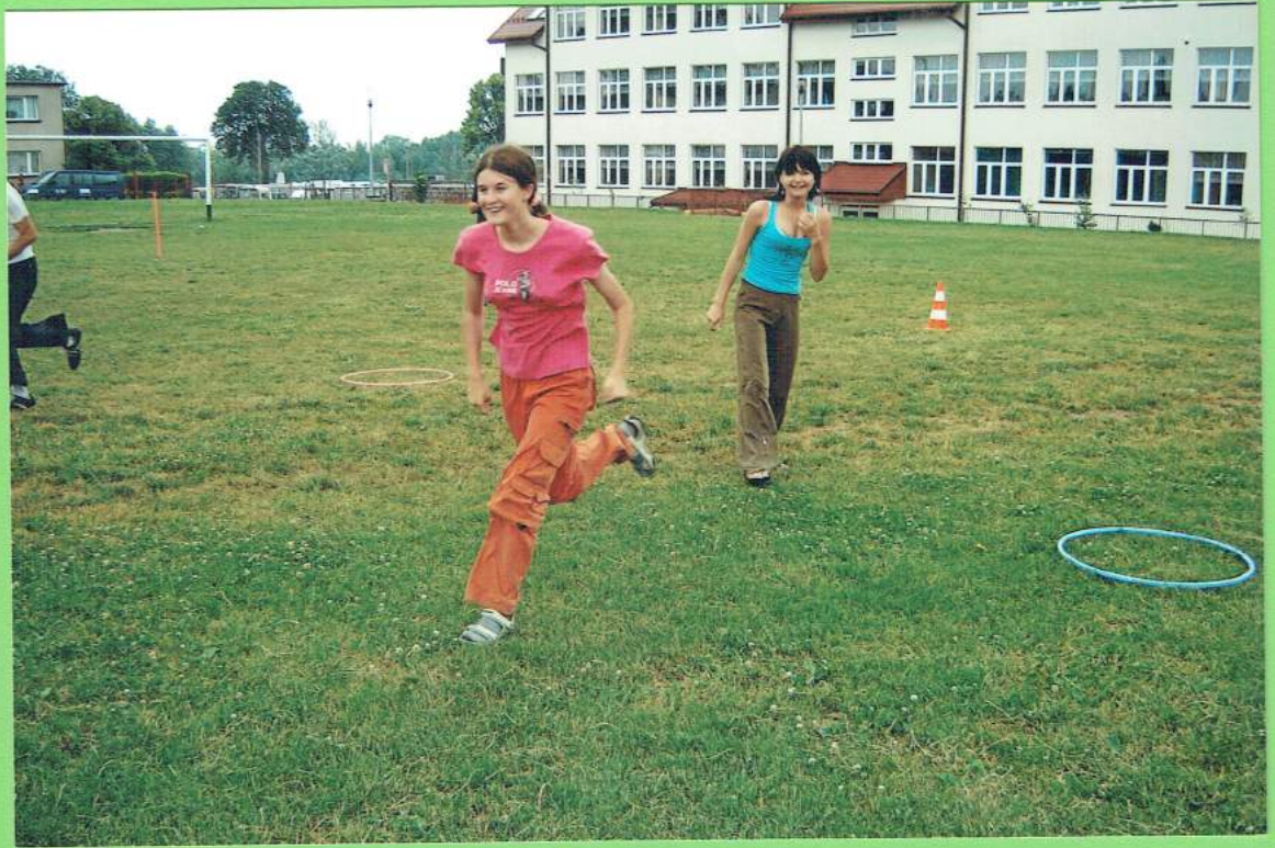
Tor z przeszkodami,