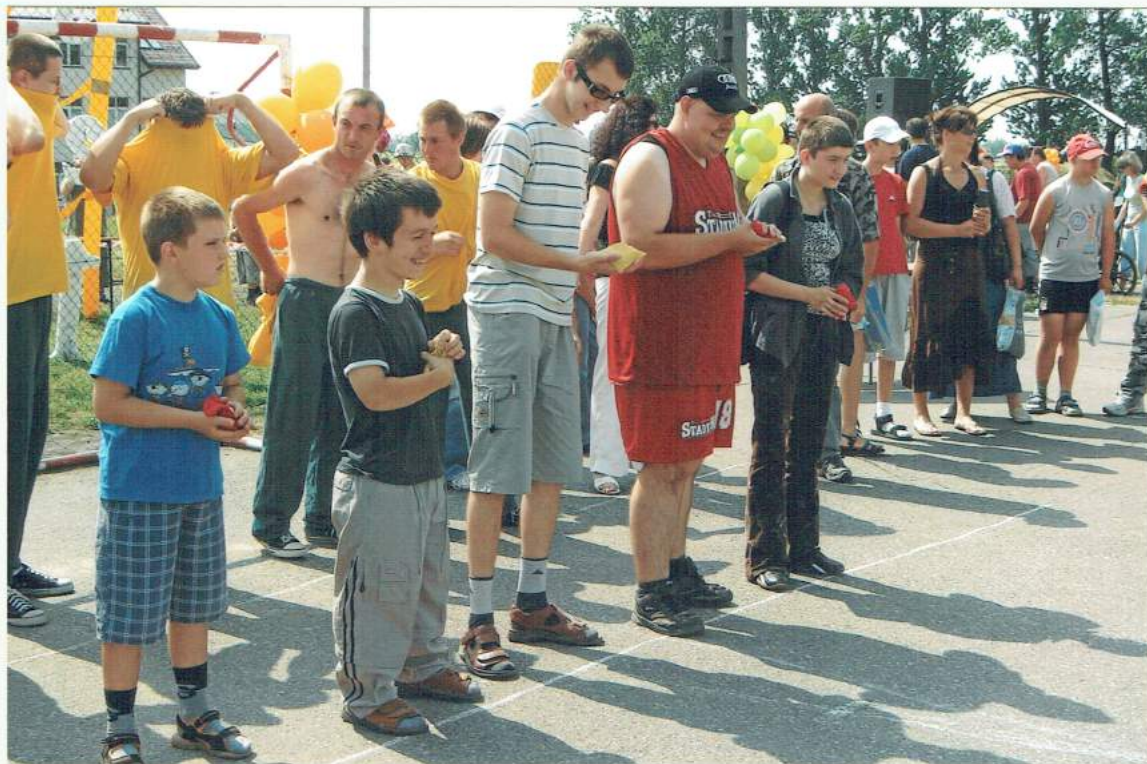
Rzut do dzika,