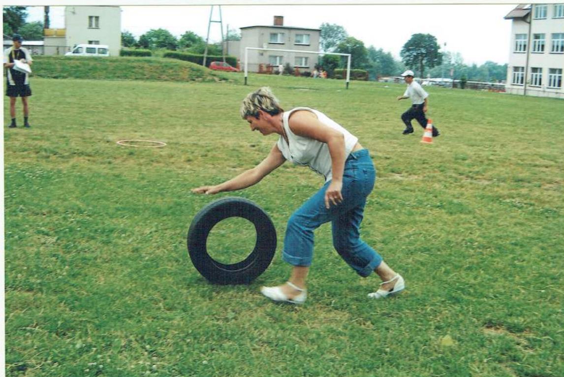
A nawet konkurs dla rodziców i opiekunów! No, no nawet dobrze poszło tym naszym mamom...