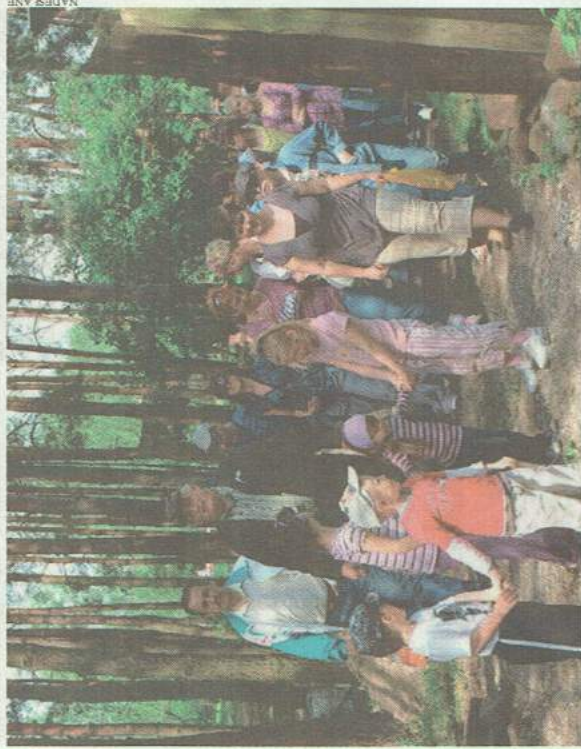
Uczestnicy spotkania ogłądali w lesie paśniki, do których chętnie zagłądają zwierzęta