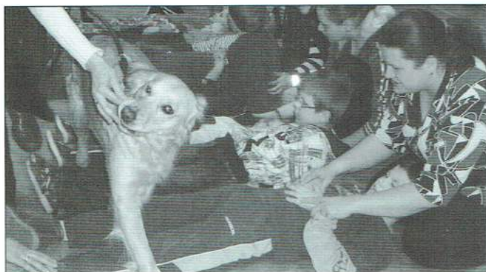
Dogoterapia to jedna z form prowadzonej w Unisławiu rehabilitacji osób niepełnosprawnych