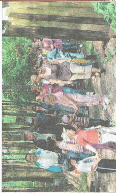
Podopieczni stowarzyszenia „Iskierki” z Unistawia brali udział w wielu ciekawych grach i zabawach, a także spacerowali po lesie