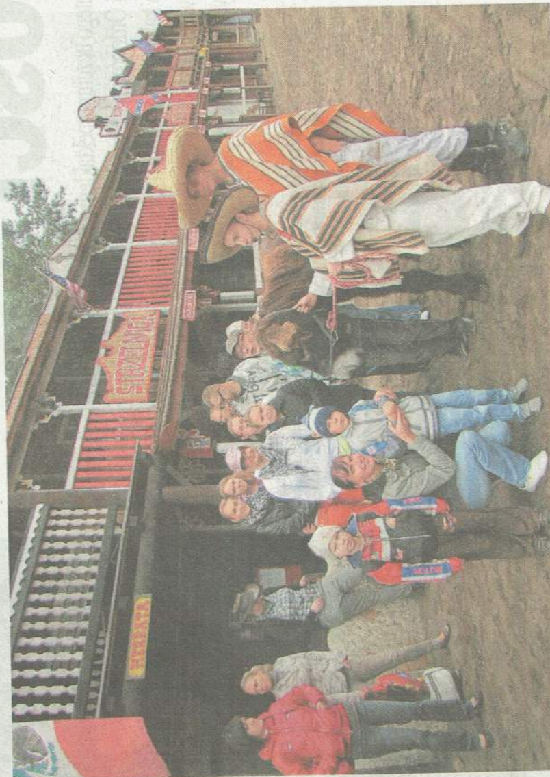
W październiku podopieczni stowarzyszenia poznawali kulturę amerykańską i zwyczaję Indian w miasteczku westernowym w Grudziądzu