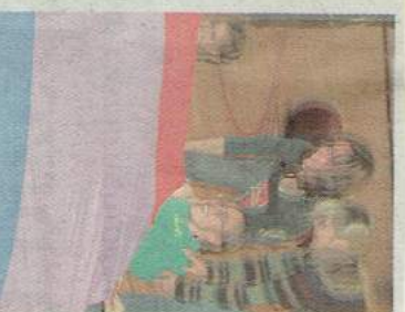
Rybak ukryty pod chustą wciągał złowione osoby