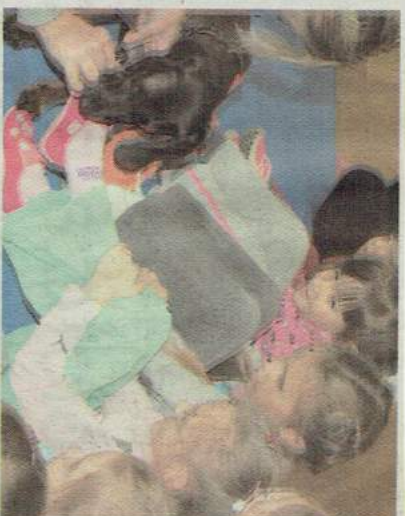
Figa zjadła ciasteczka z kaptci dziewczynnek