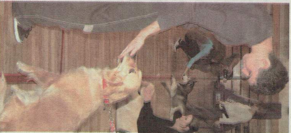
Na końcu toru przeszkód na uczestników czekały czworonogi. Każdy miał dla nich jakiś przysmak.