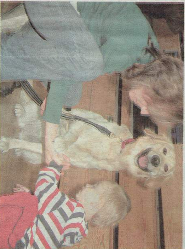
Mały Kubuś przywitał się z czworonożnym przyjacielem