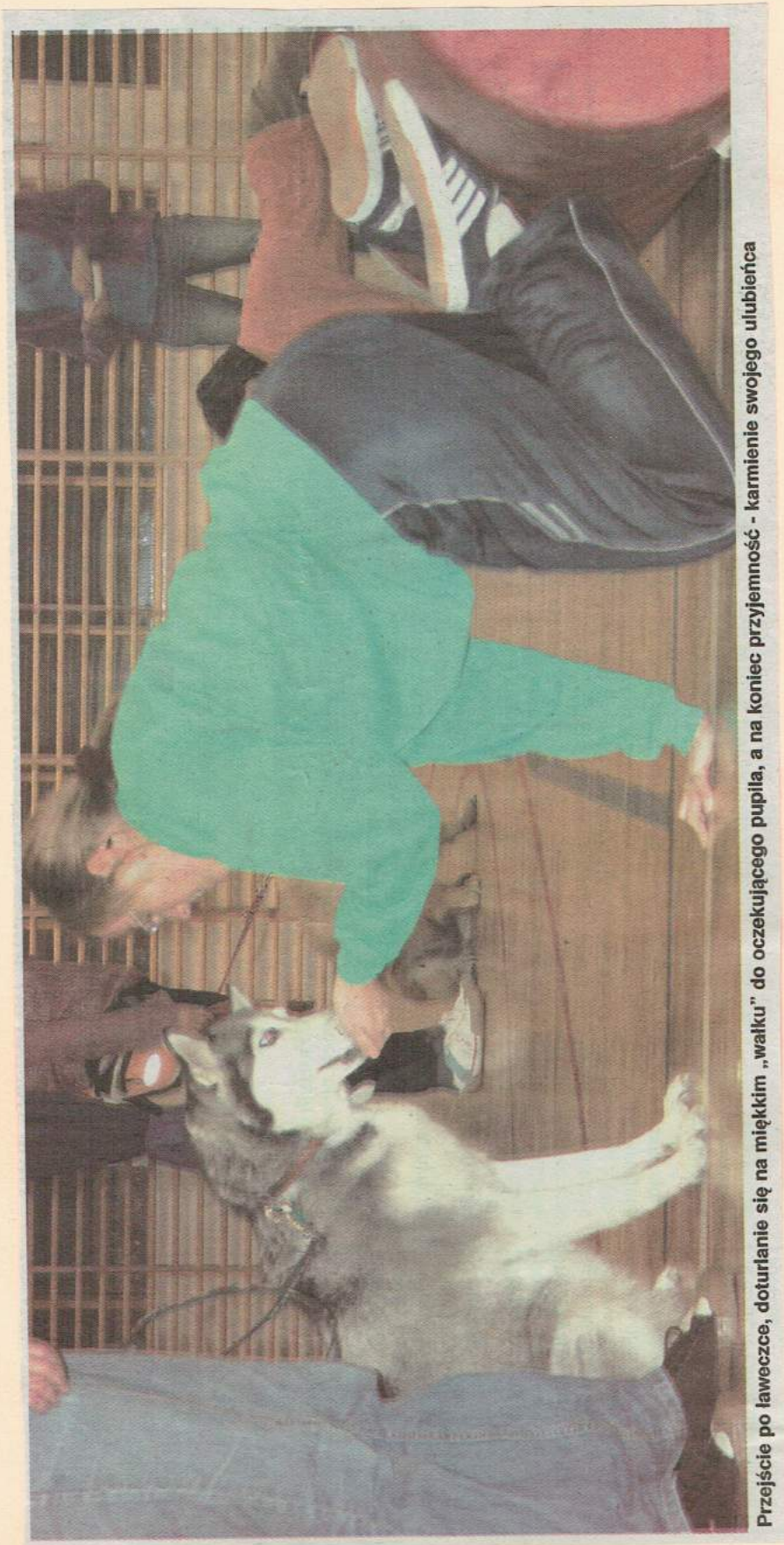
Przejęcie po laweczce, doturianie się na miękki „walku” do oczekującego pupila, a na koniec przyjemność - karmienie swojego ulubieńca