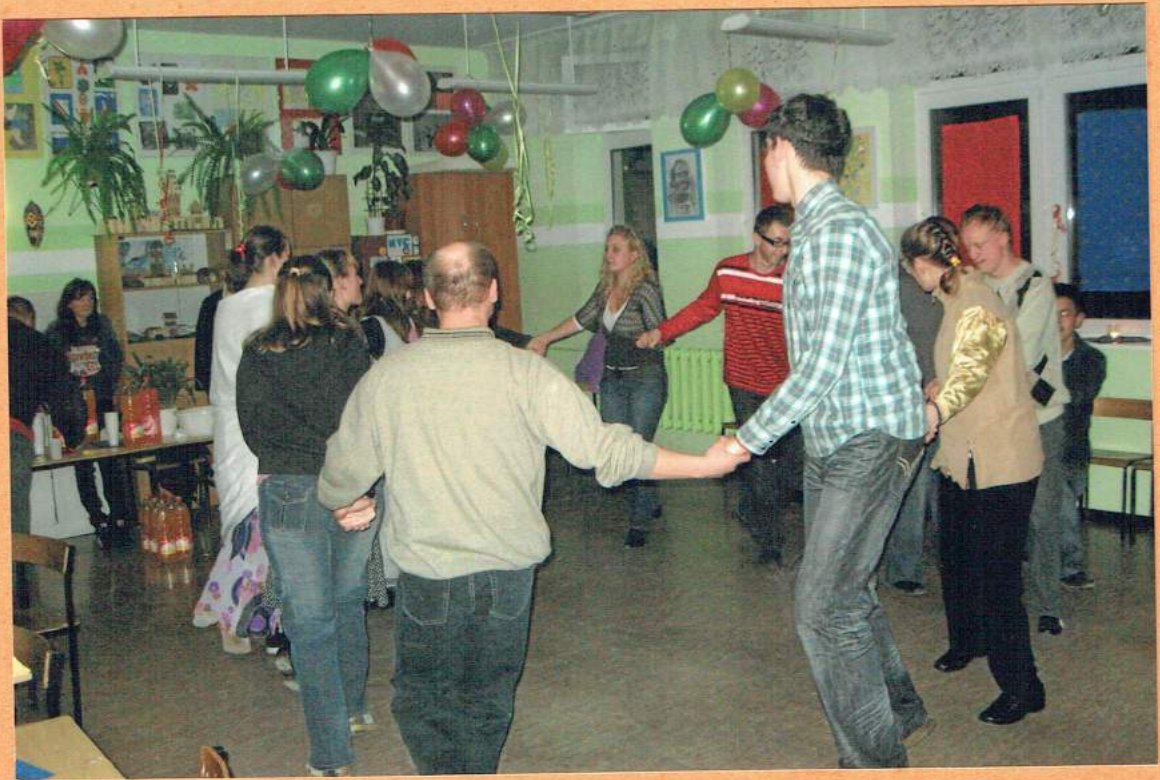
Tańce wygibance! ☺