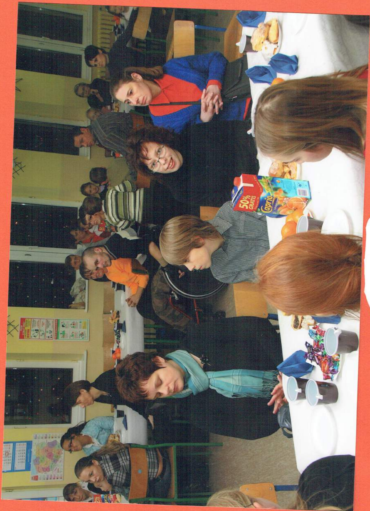
Twoske sovie podjadajisimy