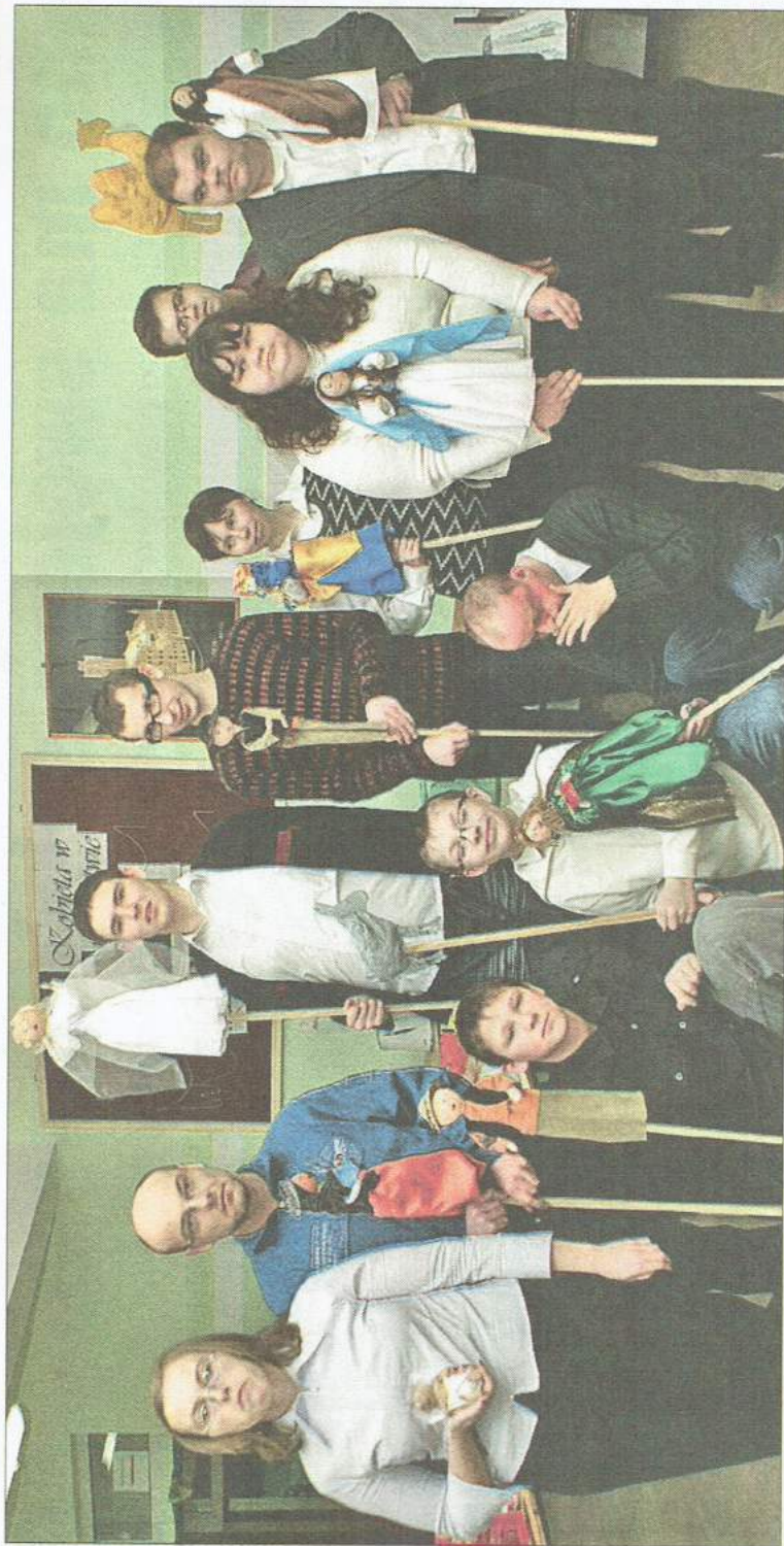
Każdy z uczestników w przedstawieniu miał swą rolę, którą odgrywał wykonaną przez siebie kukielką