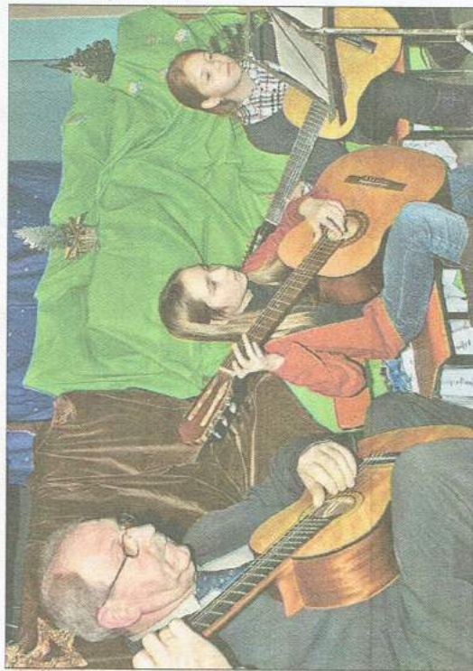
Dodatkową atrakcją wieczoru był w tym roku występ muzyków z Chelmińskiego Domu Kultury. Akordeonistka i troje gitarzystów zagrało najbardziej znane polskie kolędy