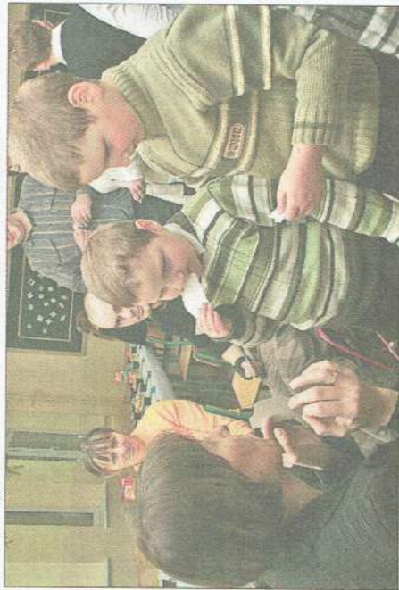
Oplatkami dzielił się wszyscy - zarówno mali, jak i duzi