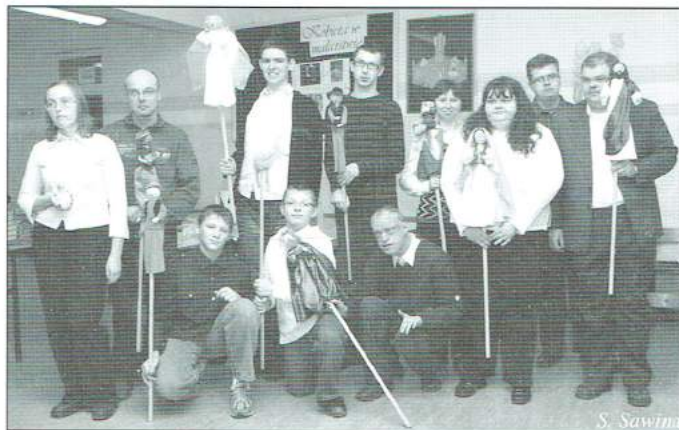
Członkowie „Iskierki” tuż przed występem...