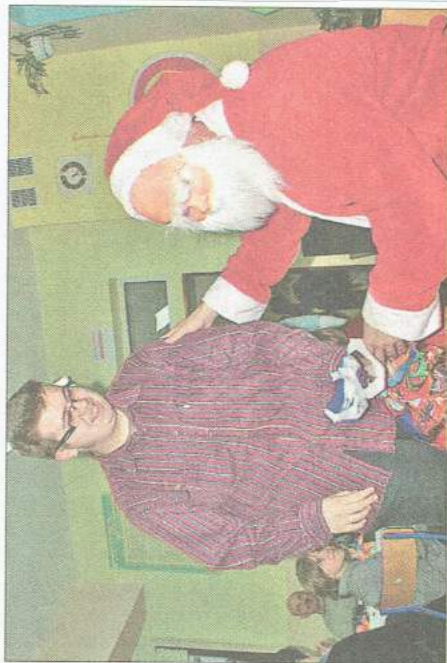
Nawet najstarsi iskierkowicze mogli liczyć na paczki od Mikołaja