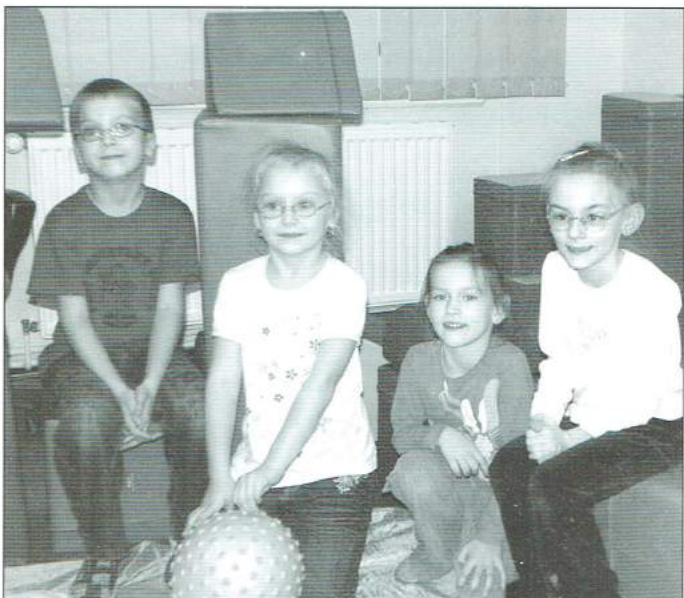
W kolorowej i wyposażonej w nowe terapeutyczne sprzęty sali...