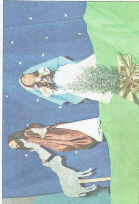
Jasełka oraz dekoracje sceniczne przygotowali podopieczni

Dwa razy w ciągu tygodnia spotykają się w grupach podczas zajęć świetlicowych oraz zamiennie na doterapii lub treningach sportowych. W okresie letnim wychowankowie „Iskierki” wjeżdżają na kolonie połączone z uwielbianymi przez nich zajęciami warsztatowymi, czego najlepszym przykładem są bożonarodzeniowe ozdoby, które wykonali specjalnie na gwiazdkowe przyjęcie.